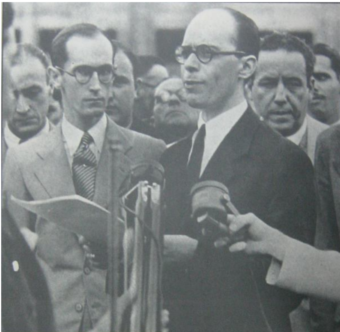
Gustavo Capanema (ao microfone), ministro de Educação e Saúde Pública, por ocasião do lançamento da pedra fundamental do novo prédio do ministério, no Rio de Janeiro. À sua direita, Carlos Drummond de Andrade, chefe de Gabinete do ministro.