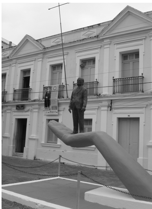
MEMORIAL CÂMARA CASCUDO: Monumento construído após a morte de Câmara Cascudo em sua memória. O solo potiguar ergue o seu mais ilustre defensor e filho.

Cascudo, como qualquer sujeito, sentia saudades dos melhores momentos da sua biografia, Cascudo sentia falta das condições de uma infância que se fez presente em toda sua trajetória de vida. Se dedicar a ciência fez dele um homem mais racional, preocupado com a verdade, a origem, a vontade de manter viva uma memória que lhe fazia bem. Trabalhar pela ciência e refletir sobre o papel do saber na compreensão de todas as suas atitudes ou de todos os seus gestos do cotidiano ao ponto de afirmar o quanto foi desgastante servir às letras durante toda sua vida e também servir àqueles que se servem dos letrados: “Meus olhos já não possuem a perspectiva do maravilhoso, normal nas crianças. Troquei pela ciência. Agora sei o quanto perdi...” 87